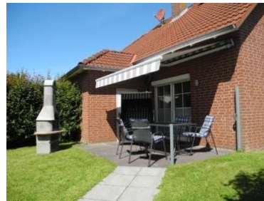
Südterrasse (nach hinten) mit Elektr. Markise, Grillkamin + Seitenmarkise